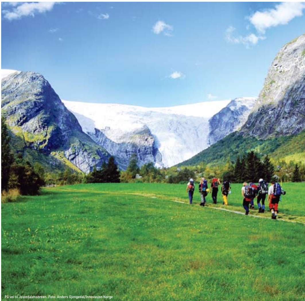
På vei til Jostedalensbreen.

Er dere to eller flere kan vekt og belastning fordeles. Fordél sikkerhetsutstyr, mat og klær mellom turfølget, slik at ingen mangler viktig utstyr hvis man skulle komme fra hverandre.