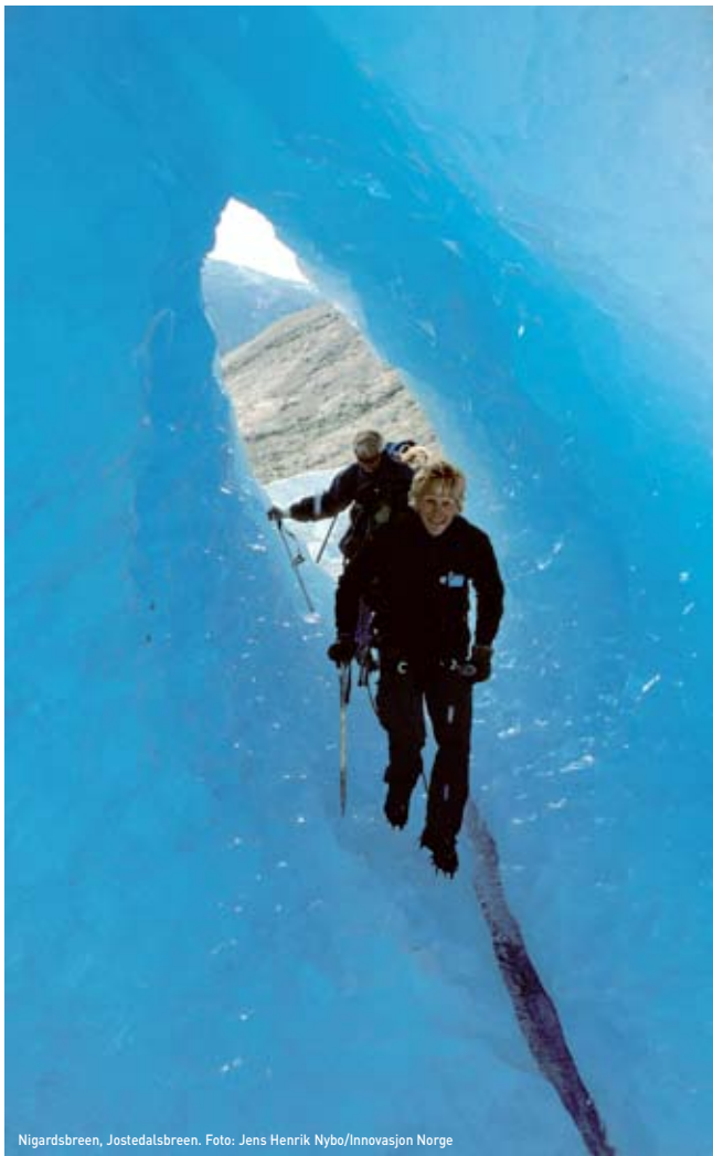
Nigardsbreen, Jostedalbreen.