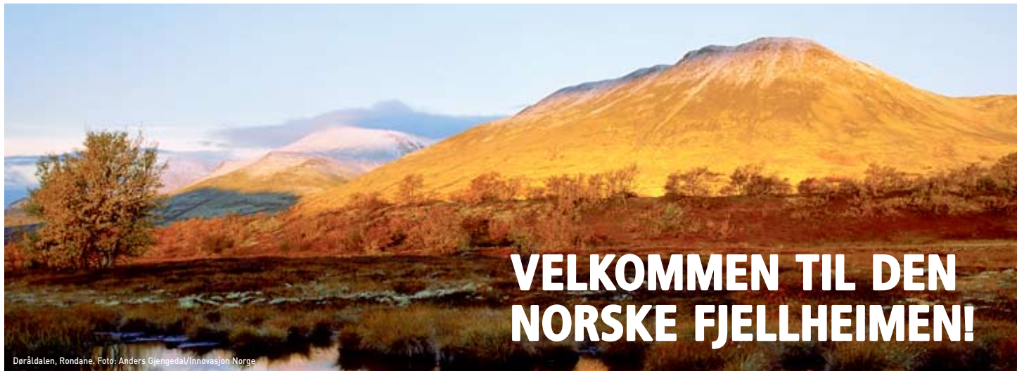
Dørråldalen, Rondane.